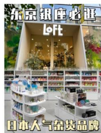
RED公式日本ロフトアカウント 紹介画像

2020年7月、中国上海市徐匯区のメロシティに、初の海外直営店である徐家匯ロフト(スージャーホイロフト)をオープン。その後、2021年1月中国成都市に双楠ロフト(シュアナンロフト)、2021年5月上海大悦城SCに曲阜路ロフト(チューフルーロフト)、2021年9月上海市に上海万象城ロフト(上海ワンシャンチャンロフト)をオープンし、現在上海市内3店舗、中国内では4店舗の直営店を展開、中国本土において事業展開を推進。