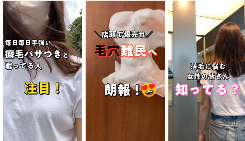
▲LetroStudioが提供する動画テンプレートの一例

また、LetroStudioが提供する動画テンプレートや動画に関する最新情報をまとめたeBook「月刊LetroStudio」、LetroStudioを導入する企業の制作事例から、どこが勝ち要素なのか、どんなデザインや訴求が効果的なのかを学び、社内でも共通認識を持つことができたことから、課題となっていたクリエイティブイメージの伝達もスムーズに行えるようになるだけでなく、組織として戦略的に検証を行うことができるようになりました。