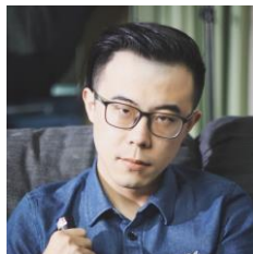
Bigger 研究所 (ビガーケンキュウジョ) <得意ジャンル> 日用品・食品等の商品レビュー <Weiboファン数> 205万