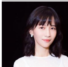
papi醬 (パピ・ジャン) <得意ジャンル> バラエティ/コメディ <Weiboファン数> 2,764万人