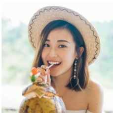
阿崔Acui (アツウイ) <得意ジャンル> ファッション/コスメ <Weiboファン数> 124万