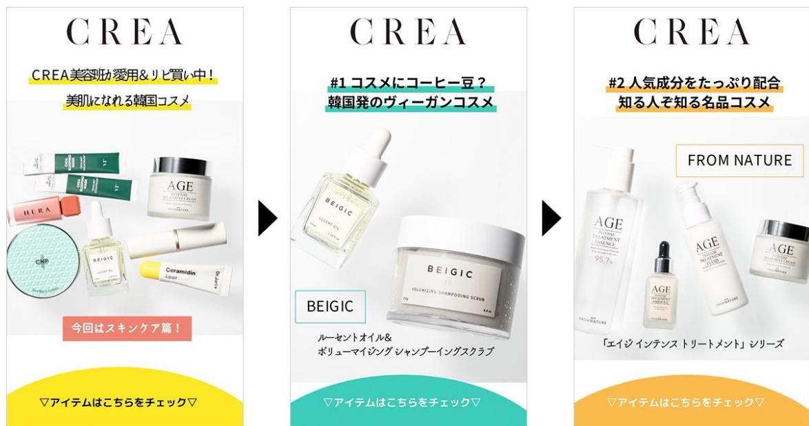
▲LetroStudioで作成した動画クリエイティブのイメージ画像

「LetroStudio」では今後も、営業活動からマーケティング施策まで幅広い接点における動画クリエイティブ活用を推進するべく機能の開発・拡充に努め、企業の施策成果向上に貢献してまいります。