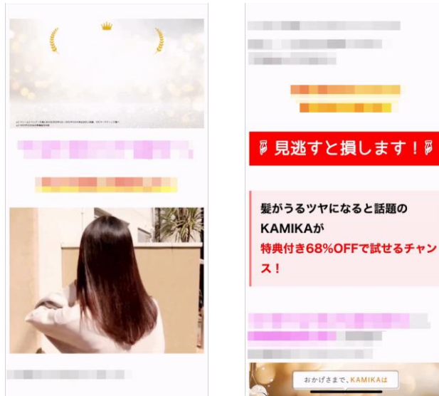
▲制作した動画コンテンツの一例

ECHでは、これまでも動画制作ツールを利用しながら様々な切り口のコンテンツを制作していましたが、このような生活者のニーズを機敏に察知し、動画コンテンツの運用を強化。新規顧客獲得LPにおけるCVRの更なる改善を目指していくために、ECサイトやLPのコンテンツ制作に適切な機能・ノウハウを持ち合わせるLetroStudioを活用し、コンテンツ制作をよりスピーディーに行い、効果検証の頻度を高めていくことになりました。