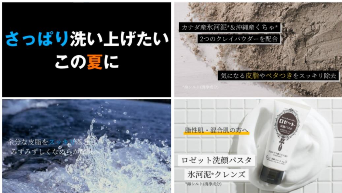
▲制作した動画イメージ