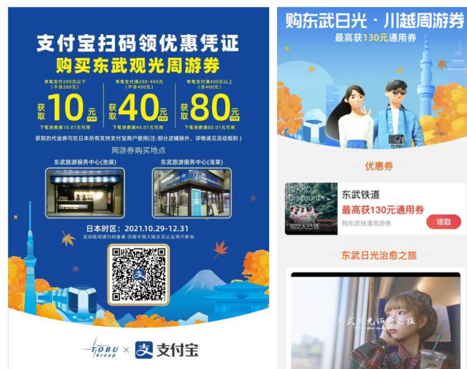
アリペイアプリ上の日光誘客キャンペーンページ

※5 自分で投稿した記事を友達同士で共有するタイムラインのような機能。記事に対して「コメント」や「いいね」を残すことが可能。