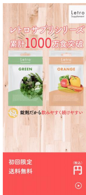
▲作成したファーストビューコンテンツのイメージ

特に、LPのCVR改善に大きなインパクトを与える「ファーストビュー」においては、ユーザーの興味・関心を引きつけやすい動画コンテンツの活用が可能となり、ファーストビューの動画化を行ったLPは平均してCVR1.2倍改善を実現しています。このようにLPの動画化が容易になったことで、ファーストビューやメインコンテンツの動画化など、CVR改善に有効な打ち手を数多く打てるようになりました。