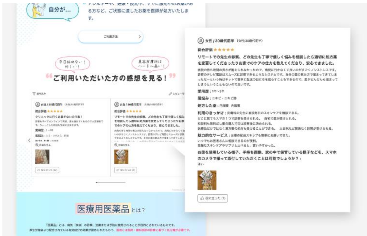
▲サイト掲載イメージ

「Letro」では、今後もあらゆるマーケティング施策において“ユーザーファースト”なクリエイティブを実現するべく機能の開発・拡充に努め、企業のマーケティング成果向上に貢献してまいります。