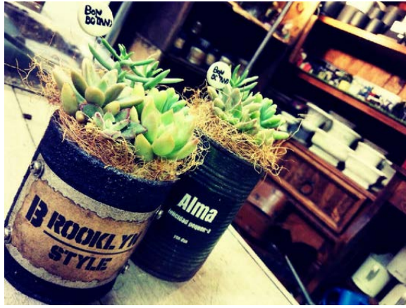
「リメ缶」投稿例 BONBOTANYさん